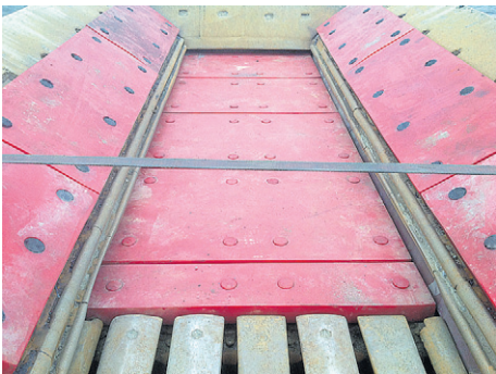
Pucest Multilayer -törmäyslevyt murskasyöttökourussa.

Tämän takia käymme yleensä tutustumassa kohteeseen paikan päällä. Samalla näemme, onko aiheellista vaihtaa käytössä ollut kulumistorjuntamateriaali johonkin toiseen. Päämiehet tarjoavat jatkuvaa koulutusta ja