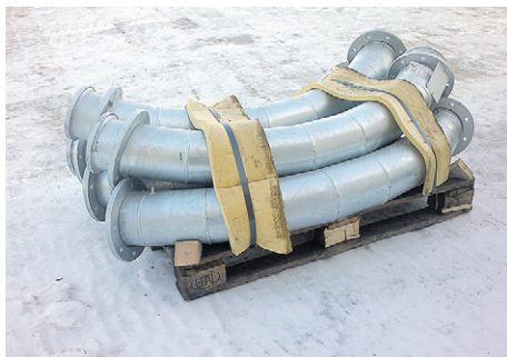
Pneumalinjan Abresist-vuorattuja putkikäyriä.

- On meidän ammattitaitoamme löytää lopukäyttäjälle kustannustehokkain vaihtoehto.